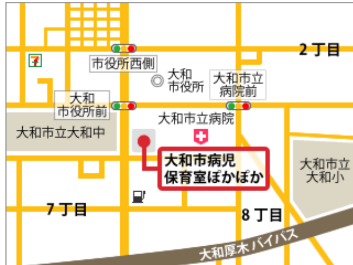
大和市病児病後児ほかほか